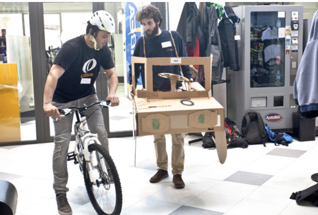
Proyecto ORBEA ALL USE CREATIVE EXPERIENCE con ORBEA + Conexiones Improbables . Cocreación de soluciones para ayudar a los no usuarios de bicicleta a acertar en la elección de su primera bici.