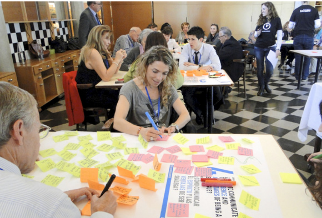
Proyecto NEXT TOURISM con SKÁL INTERNACIONAL SPAIN . Cocreando las líneas estratégicas de la Asociación de profesionales del turismo SKÁL durante su 57 Congreso Nacional .

Cocrea desde el principio... (o de cómo integrar a tus usuarios/clientes desde el principio es lo mejor que puedes hacer)