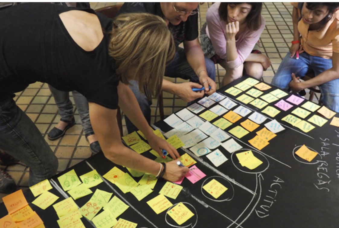
Proyecto #NovaSalaRegàs con Centre Cívic Pont Major. Rediseño de la sala común del Centro Cívico con la participación de los tres servicios -Centro Cívico, Biblioteca y Servicios Sociales- y los usuarios del centro.