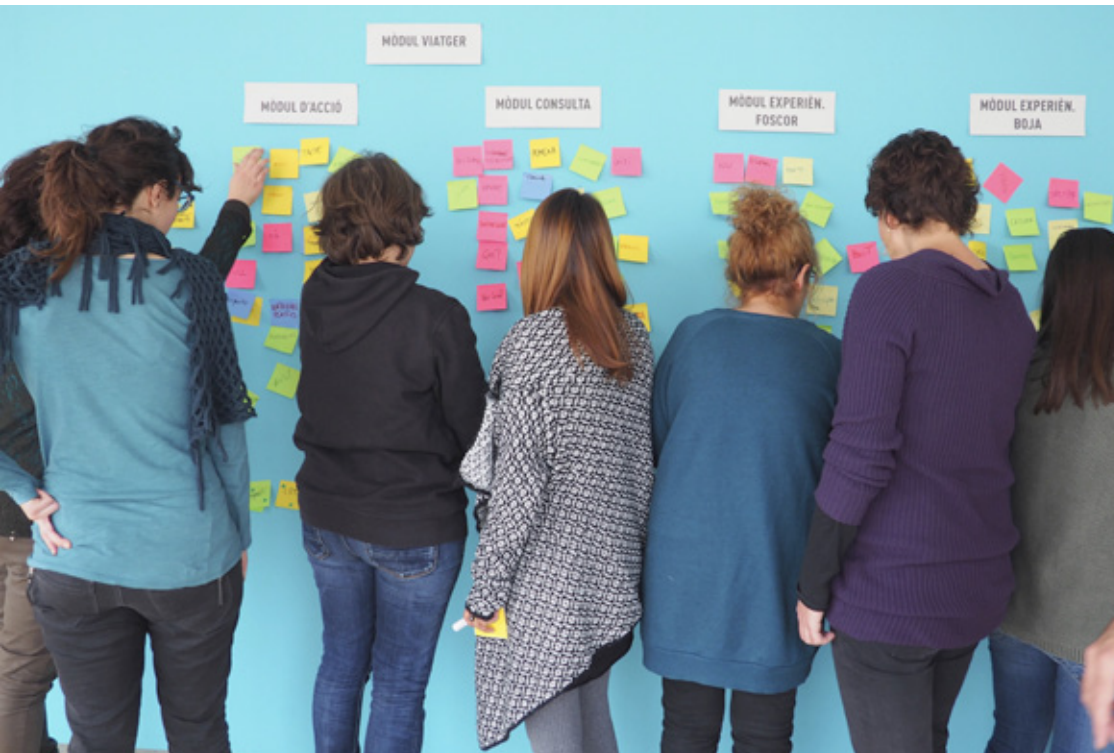
Proyecto #NouMiniEspai con ACVIC (Centre d'Art Contemporani de Vic). Rediseño del espacio infantil del Centro de Arte Contemporáneo con la participación de los alumnos del Curso de cocreación de espacios infantiles y familias usuarias del centro.