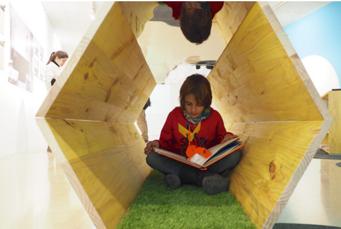
Proyecto #NouMiniEspai con ACVIC (Centre d'Art Contemporani de Vic). Rediseño del espacio infantil del Centro de ARte Contemporáneo con la participación de los alumnos del Curso de cocreación de espacios infantiles y familias usuarias del centro.

¿Esto venderá? Ponlo a la venta y lo sabrás (o de cómo el Producto Mínimo Viable va a cambiar tu vida)